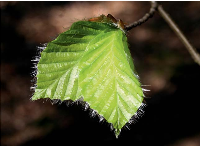
Zarte Buchenblätter und Frühlingstriebe