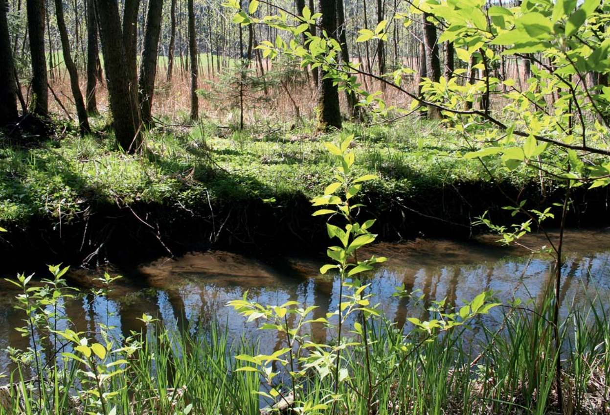
Brauner Kupferbach in grünem Wald

Der Kupferbach ist ein Zufluss der Glonn, die wiederum 26 Kilometer weiter südlich bei Bad Aibling in die Mangfall mündet.